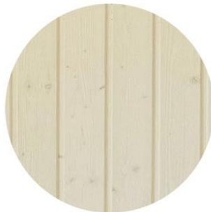
Friso abeto Barnizado blanco