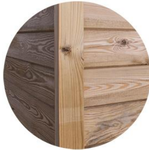
Duela solapada madera Madera tratada