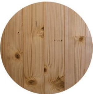
Friso abeto Barnizado natural