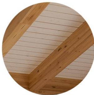
Estructura barniz natural Panel sandwich blanco