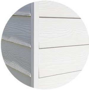
Fibrocemento Cedral Opción de varios colores