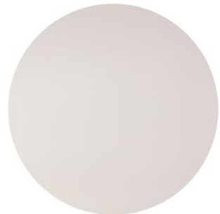
Panel cartón yeso Pintado blanco