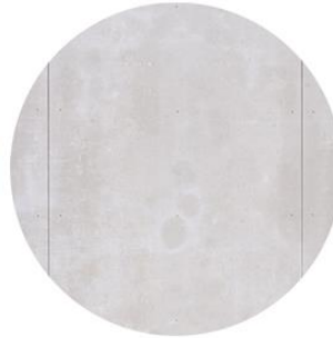
Panel fibrocemento Viroc Color gris