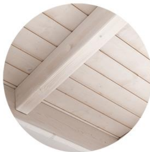
Estructura barniz blanco Panel sandwich blanco