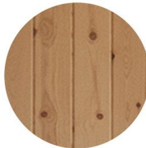
Tarima pino Barnizado natural