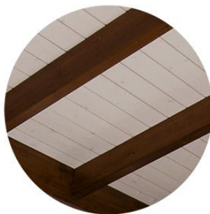
Estructura barniz nogal Panel sandwich blanco