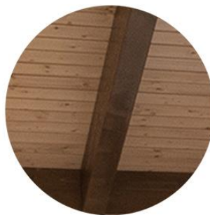
Estructura barniz nogal Panel sandwich natural