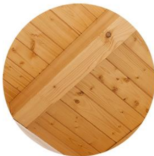
Estructura barniz natural Panel sandwich natural