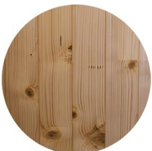
Friso abeto Barnizado natural