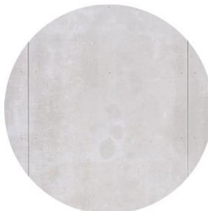
Panel fibrocemento Viroc Color gris